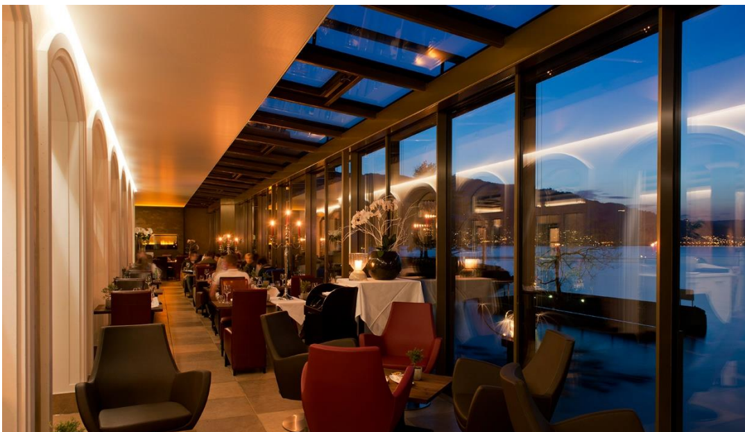
Restaurant Aiola Stansstad