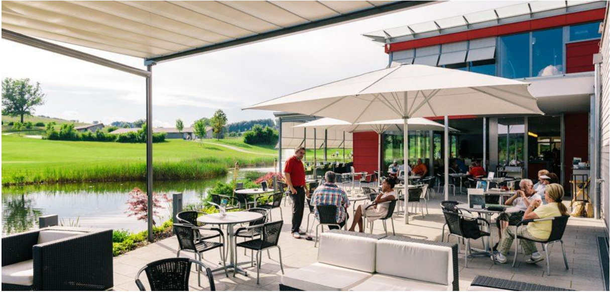
Restaurant Oase beim Golfpark Oberkirch